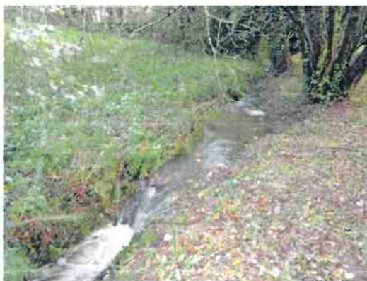
Le ruisseau de Fétan Blay

J'insiste encore une fois sur la protection des ruisseaux et de leurs zones humides ; la photo interprétation choisie pour définir les zones à classer montre à cette occasion ses limites. En effet, sur les photos aériennes, ces ruisseaux ne sont quasiment pas visibles, à tel point que dans l'enquête publique récente (Enquête publique relative au projet de restauration des bassins versants du Vincin, du Bilair et du Plessis dans le cadre du contrat Territorial Volet Milieux Aquatiques (CTMA) ouverte du 26 octobre 2022 au 12 novembre 2022) sur la restauration du bassin versant du Vincin (entre autres), le ruisseau de Fétan Blay a carrément été oublié ! alors que c'est un affluent non négligeable de la rivière du Vincin.